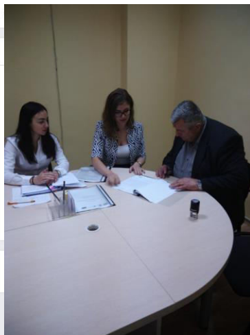
Местна Инициативна Група - МИГ- Кирково Златоград